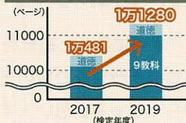
中学校の教科書の平均ページ

ところが、授業時間数は現在の指導要領と変わっていません。同じ時間数でこれまで以上に分厚い教科書を読み解いていかなければならず、正確な読解力とスピードが求められます。